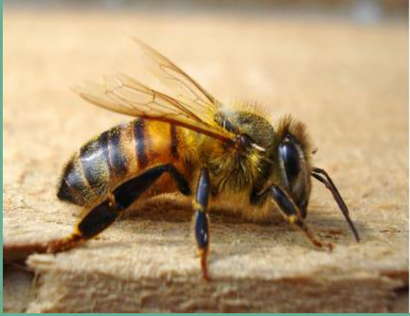
ଠି ଠଟ଼ି଼ା Apis cerana