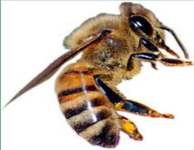
ଢିଢିରା (giant honey bee)