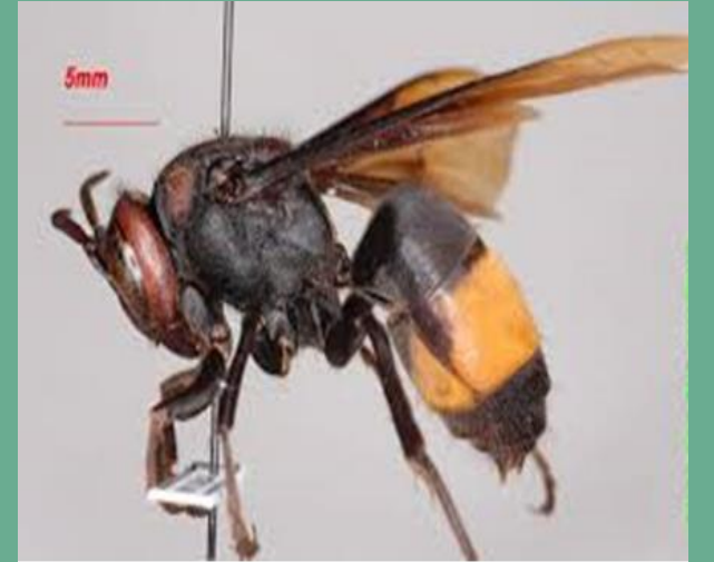
ଢେଢିରା Vespa affinis affinis